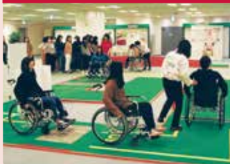
乘坐轮椅，感受有障碍的路面和开关门的体验。