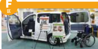
福利车辆，老人车等展出安全地扩展移动范围的移动机器人和关于防灾的展示。