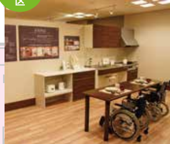
这里是展出无障碍住房的模型区，有客厅，厨房，卧室等各种场景提案。