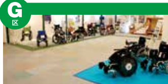
展示各种轮椅，在并设的“轮椅体验区”可以试乘。