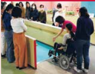
感受电动轮椅的机能和乘坐体验。