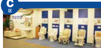
生机勃勃日常中不可缺少的健康。这里展出有，为了健康日常的生活辅助用品和各种护理器关联商品。