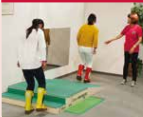
穿着装备，模拟体验高龄者感受。