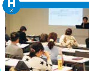
“积极·交流广场”是一处，以护理预防为目的的，为明朗地、愉快的舒畅地歌颂祝福第二人生的积极的老年人开设的交流区。以50岁以上的人群为对象，支持新交流的同时，发布生活、兴趣、健康、工作、参与社会风多种的领域的情报。此外，还经常举办各种各样的活动·研讨会。