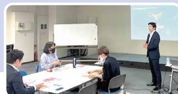
ワークショップの様子▶